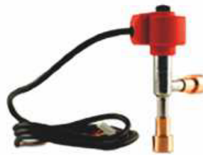
Válvula de expansión electrónica Electronic expansion valve