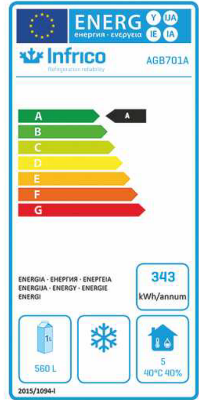
Mejora de la clasificación energética Improved energy efficiency