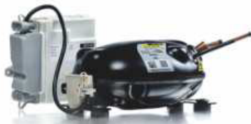
Compresor de velocidad variable Variable-capacity compressor