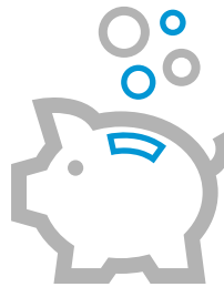
Coste estimado de 0,20 €/ kWh Estimated energy cost of 0,20 €/kWh