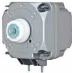
Motoventiladores EC EC motorfans